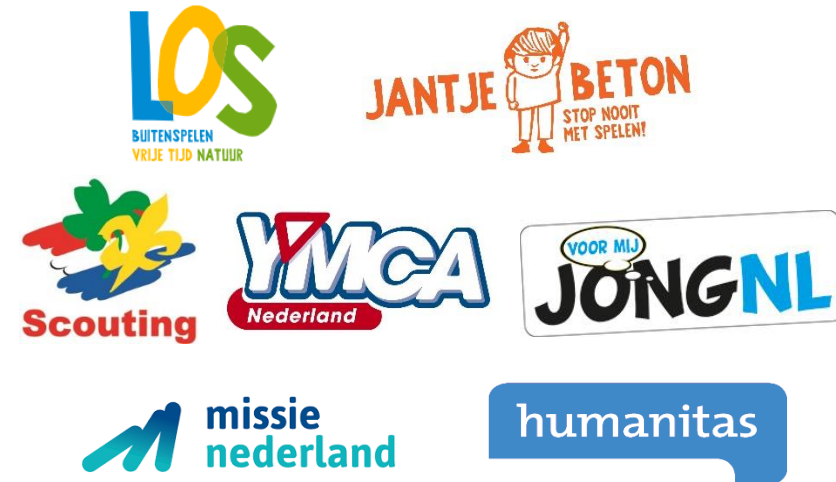
Figuur 1 Organisaties betrokken bij interviews en validatiesessie

Voor de inventarisatie van effecten van vrijwillig jeugdwerk hebben we ook informatie opgehaald bij vertegenwoordigers van vrijwillig jeugdwerkorganisaties. Het gaat dan enerzijds om het bereik van hun activiteiten (aantallen jeugdigen, vrijwilligers), anderzijds om de effecten die zij ervaren. We hebben gesproken met Scouting Nederland, YMCA, JongNL Limburg, MissieNederland en Humanitas. De organisaties richten zich op kinderen en jeugdigen in Nederland. Elke organisatie heeft een duidelijke eigen identiteit. De meeste van deze organisaties hebben pedagogisch beleid en hun activiteiten zijn gericht op niet-formeel leren.