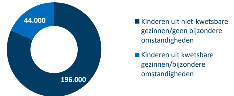
Figuur 3 Verhouding kinderen uit kwetsbare gezinnen of bijzondere omstandigheden op het totaal

* Er is geen aparte schatting beschikbaar van het aantal extra vrijwilligers in vakantiekampen.